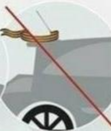
на кузове автомобиля

Помните, ленточка – это не просто кусок ткани. Это символ Победы над фашизмом!