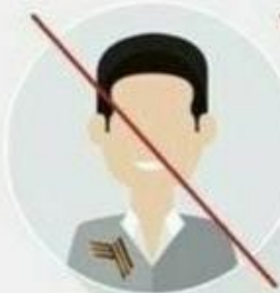
в испорченном виде